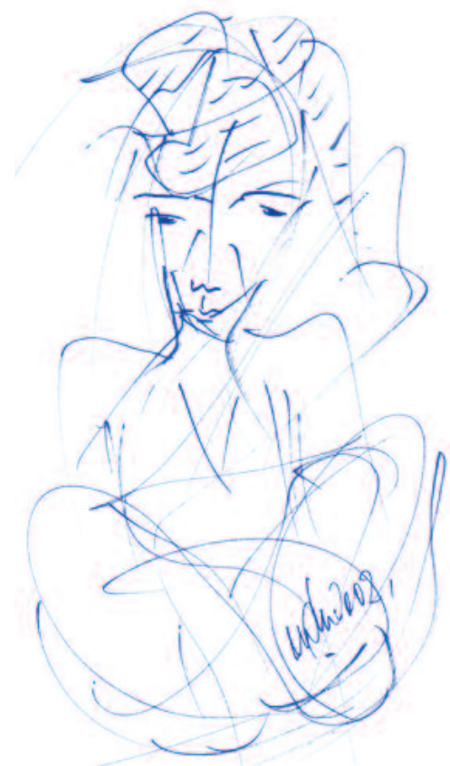
Dibujo original de Miguel Oscar Menassa (D3225)