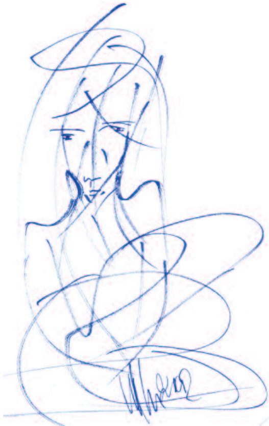
Dibujo original de Miguel Oscar Menassa (D3227)

que tiene que pagar. Enseñarles a hablar para que comprendan nuestras ideas. Hay algo en la educación que, todavía, no comprendo.