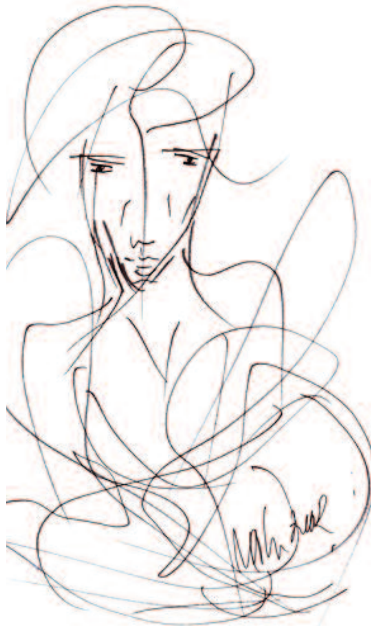
Dibujo original de Miguel Oscar Menassa (D3226)