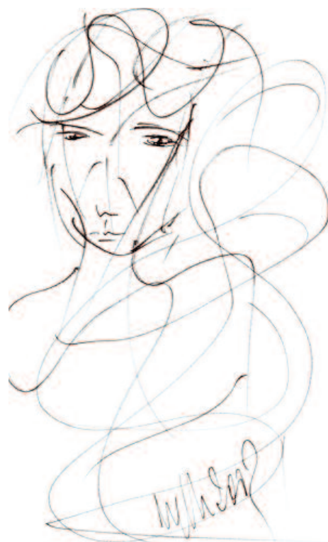
Dibujo original de Miguel Oscar Menassa (D3222)