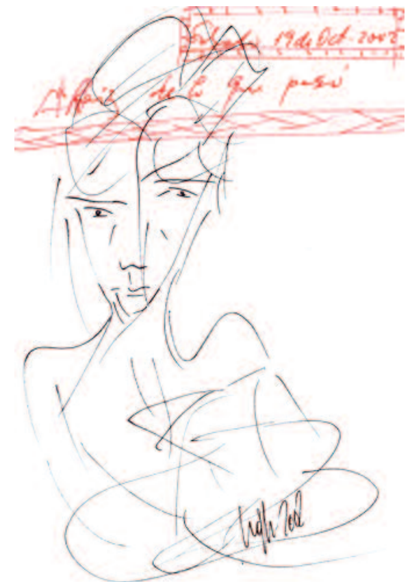
Dibujo original de Miguel Oscar Menassa (D3190)