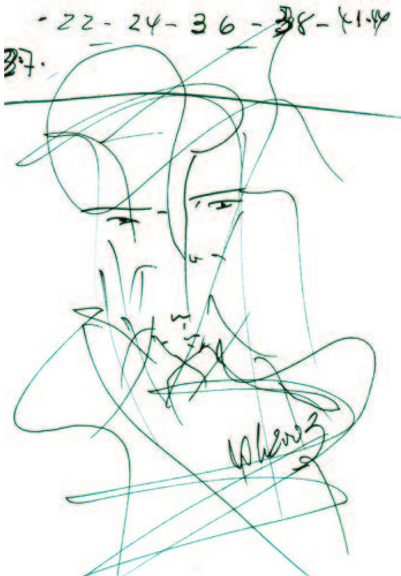
Dibujo original de Miguel Oscar Menassa (D3213)

Cincuenta años más, eso quiero, el resto lo puedo tolerar bien, venga como venga.