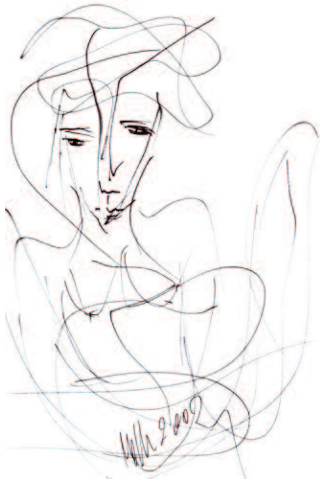
Dibujo original de Miguel Oscar Menassa (D3221)